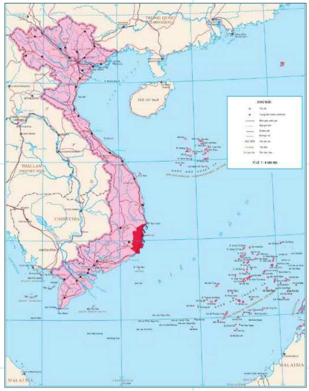
VỊ TRÍ TỈNH KHÁNH HÒA TRONG LÃNH THỔ VIỆT NAM