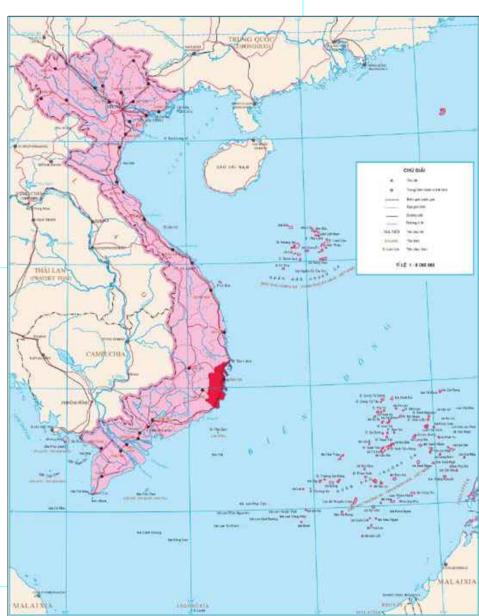
VI TRÍ TỈNH KHÁNH HÒA TRONG LÃNH THỔ VIỆT NAM